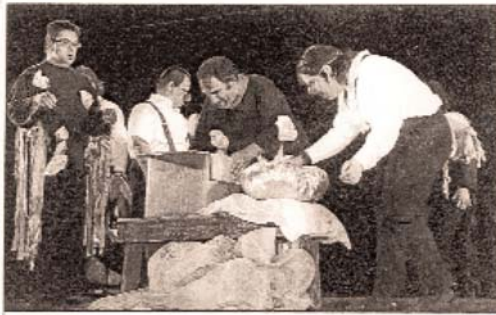
Le burlesque et le poétique se sont cotoyés dans la série de tableaux.

Dans une série de tableaux, le burlesque et le poétique se côtoient. L'ensemble se déroule sans temps morts, de façon agréable. On rit beaucoup et on s'émue également. Fruit d'une longue rencontre entre adultes handicapés des éta-